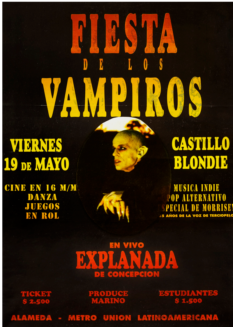
Figura 5. "Fiesta de los vampiros". Afiche para fiesta en discoteque Blondie, c. 1995.