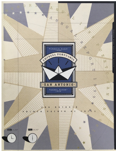
Figura 8. “Empresa Portuaria de San Antonio”. Memoria anual de la empresa, 1999. Autores: Ximena Ureta y Pablo Lugenstranss.