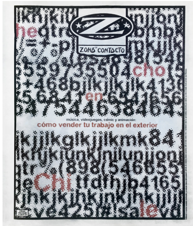
Figura 2. "Zona de Contacto". Portada de suplemento del diario El Mercurio , publicado el 4 de junio de 1999. Autor: Iván Villalobos.