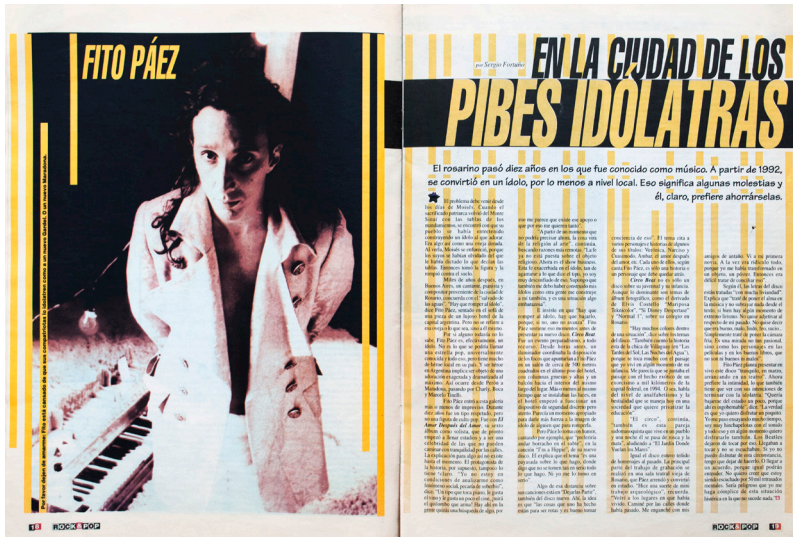
Figura 3. "En la ciudad de los pibes idolátras". Artículo de la revista Rock & Pop , publicado el 1 de enero de 1995. Dirección de arte: Andrés Yankovic.