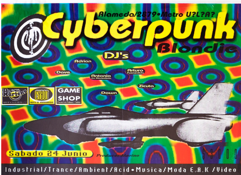
Figura 4. "Cyberpunk". Afiche para fiesta en disquete Blondie, c. 1995.

buscaron adquirir una identidad gráfica, entre ellos, una variedad de personajes públicos, regiones, reparticiones de gobiernos y entidades provenientes del mundo privado. De este modo, el racionalismo moderno que Tejeda describiría como "una lista de prohibiciones" (2007, p. 212) fue dejado de lado. En relación con lo anterior, en la década de 1990 se encontró un nicho en la elaboración de memorias anuales de empresas, publicaciones editoriales cuyo contenido consistía en los objetivos, ideas y proyecciones de la compañía, en un formato agradable y "que no pareciera el libro estándar de diseño editorial" (Naranjo, comunicación personal, febrero de 2018). Este material, sirviéndose de la identidad corporativa y las acciones de la empresa, tenía por finalidad buscar un mejor posicionamiento como marca e informar, de forma atractiva, su gestión anual. En tal sentido, este producto de mercado