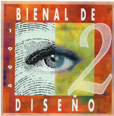
Figura 7. “Segunda Bial de Diseño”. Identificador gráfico de la segunda Bial de Diseño, llevada a cabo en el año 1994. Autora: Paula Celedón.